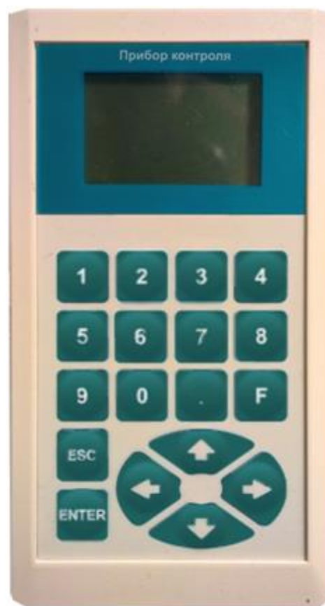
Рисунок 1 – Внешний вид ПК-1.